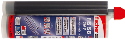
Superbond-Mörtel FIS SB